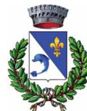
COMUNE DI SAUZE D'OULX